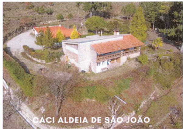
CACI ALDEIA DE SÃO JOÃO