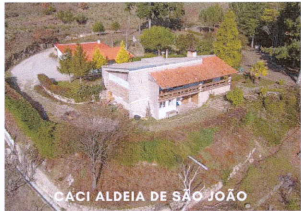
CACI ALDEIA DE SÃO JOÃO