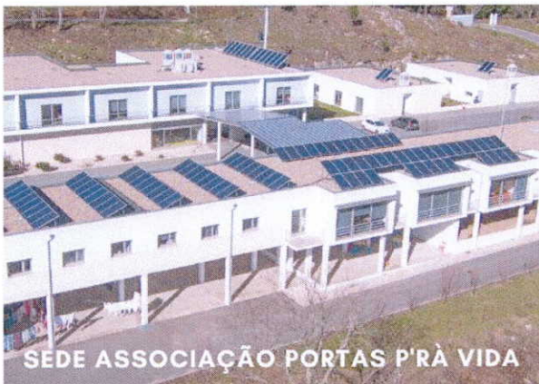
SEDE ASSOCIAÇÃO PORTAS P'RA VIDA